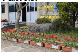
陸前高田市内小学校で並んだプランターのチューリップ