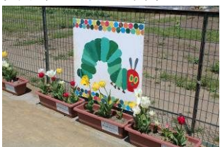
東松島市内保育所で園児たちを迎えるチューリップ

被災地にお届けする球根の仕分け作業を手伝ってくださるボランティアを募集します。 グリーンアドバイザー資格をお持ちの方、グリーンアドバイザーの活動に関心のある方の参加をお待ちしています。