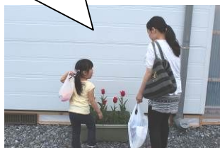
大船渡市仮設住宅でチューリップを眺める親子